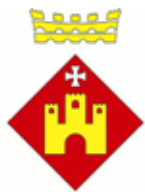
Ajuntament de Sitges

El Club Natació Sitges , compta amb la col·laboració d'organismes oficials i de nombroses institucions i entitats locals, el que fa que les proves que organitzem, sigui un referent en les proves esportives i esdeveniments esportius a nivell nacional i que els dona la oportunitat de donar-se a conèixer a un ventall més ampli de públic.