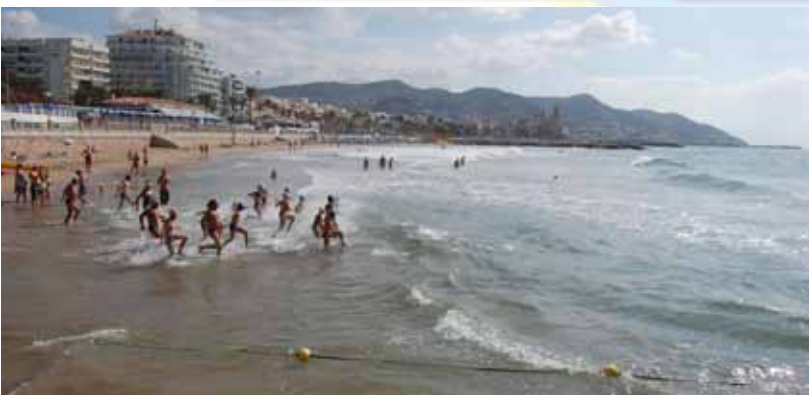
RiuMar.com Especialistas en Kayak & Canoa